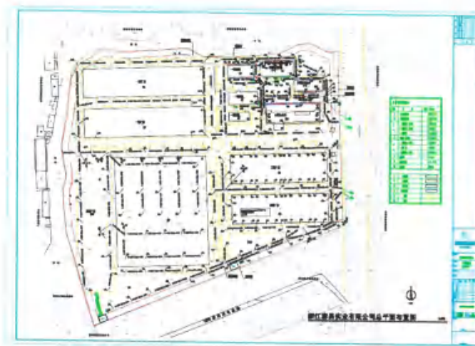
图 2.1 浙江泰昌实业有限公司生产厂区平面图

浙江泰昌实业有限公司总平面图如图 2.1 所示。厂区主要由行政办公楼，实验楼，宿舍楼，铝制品车间，铁制品车间，成品车间及露天仓库等组成。